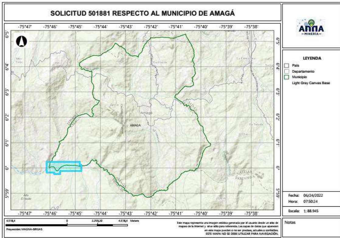
Gráfica N°2 Ubicación geográfica del área de interés

El área está ubicada en las veredas El Porvenir, El Recreo, Pueblito de San José, Cerro Tusa y Travesía de los municipios de AMAGÁ, TITIRIBÍ Y VENECIA Departamento de Antioquia , como se muestra en el gráfico N°2: