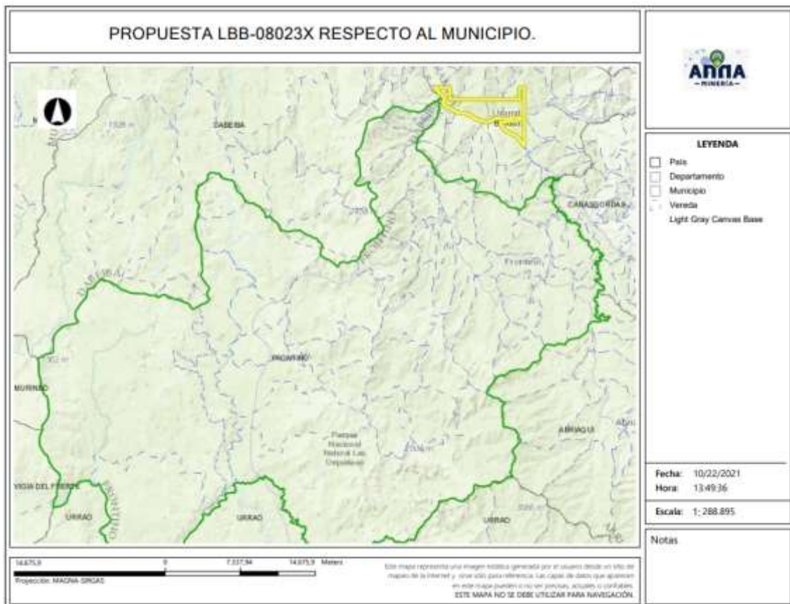
Gráfica N°2 Ubicación geográfica del área de interés

El área está ubicada en las MURINDO veredas del municipio de FRONTINO ; CIENAGA, MURRAPAL, LIMON CABUYAL, SAN FRANCISCO, CAUNCE, ENCALICHADA, PEÑAS BLANCAS, FRONTINO y AMBALEMA del municipio de URAMITA del Departamento de Antioquia , como se muestra en el gráfico N°2: