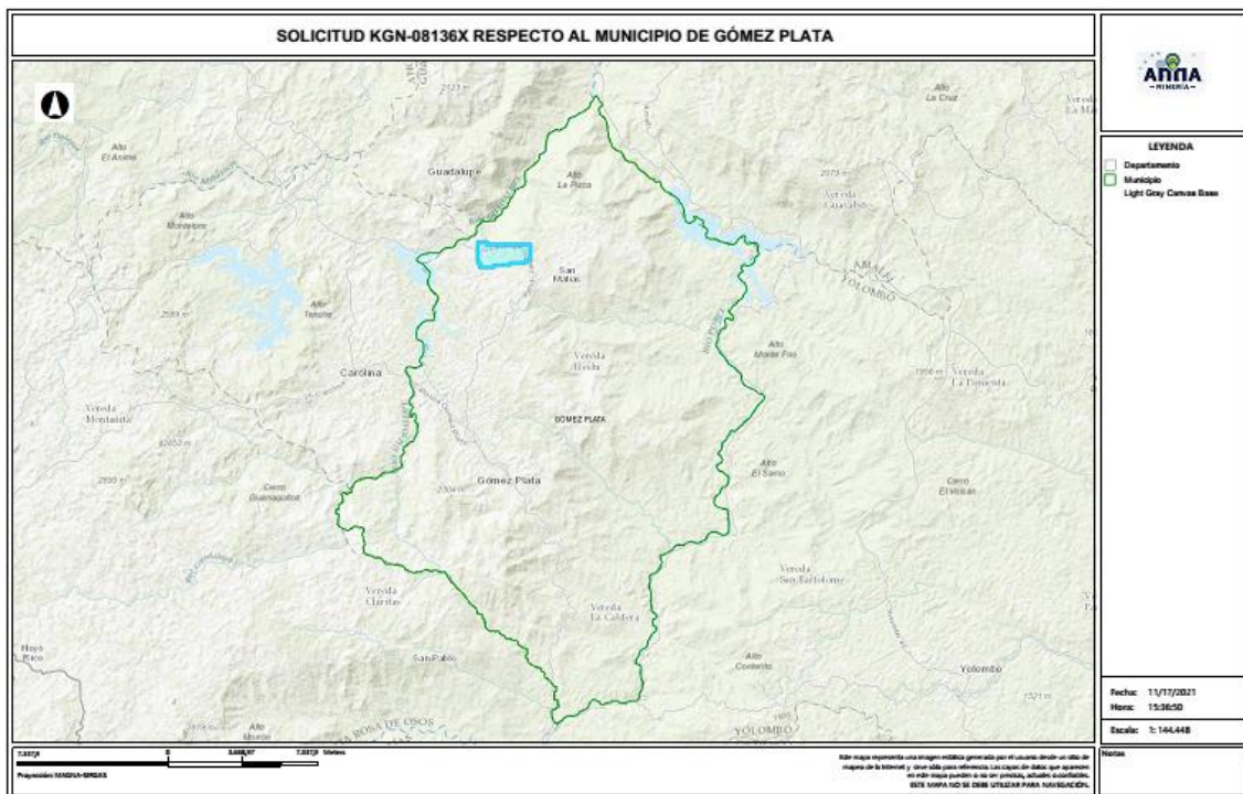
Gráfico N°2 Ubicación geográfica del área de interés

El área está ubicada en las veredas El Oso, La Arenera y Cañaveral del municipio de GÓMEZ PLATA Departamento de Antioquia , como se muestra en el gráfico N°2: