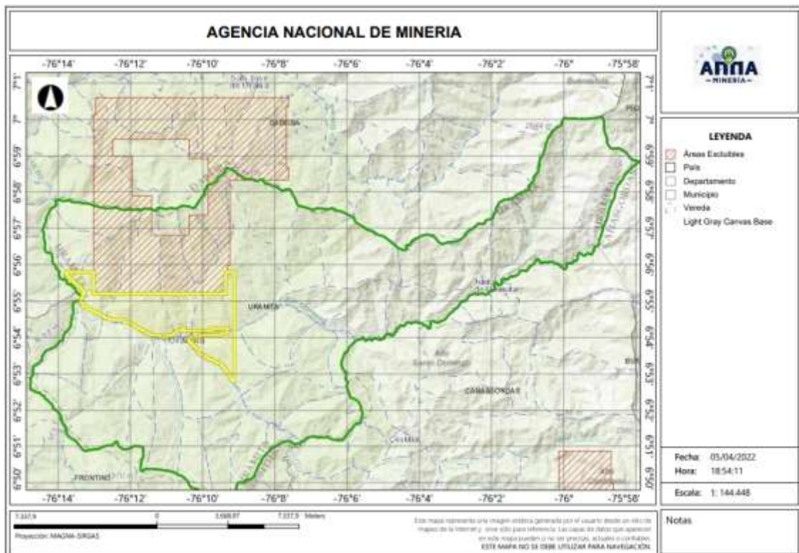
Mapa del la propuesta respecto al municipio

El presente documento es de carácter informativo y no tiene ningún efecto legal. Dado que es un requisito informativo.