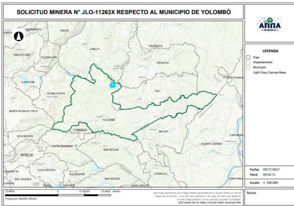
Gráfica N°2 Ubicación geográfica del área de interés

El área está ubicada en la vereda Maracaibo del municipio de Yolombó , Departamento de Antioquia , como se muestra en el gráfico N°2: