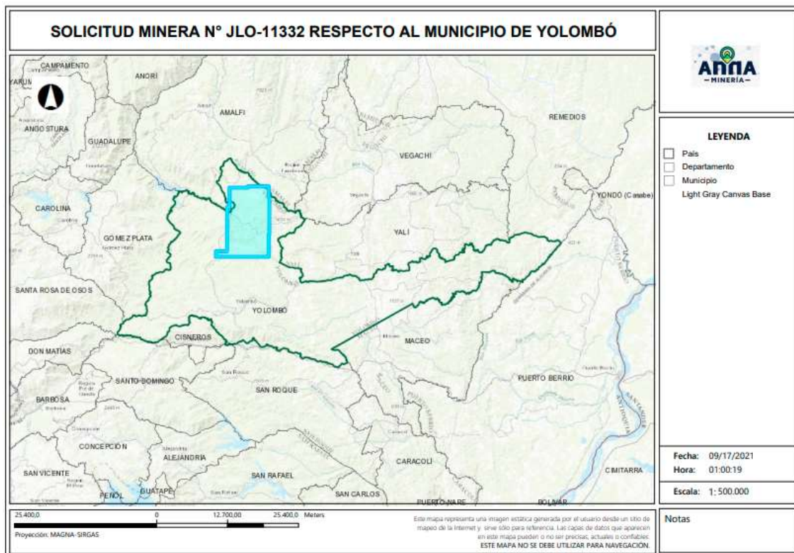
Gráfica N°2 Ubicación geográfica del área de interés

El área está ubicada en las veredas La Indiana, Las Frías, La Cruz, La Cordillera, Cachumbal, Barro Blanco, El Comino, Aguabonita, San Agustín, La Gergona, La Cabaña, La Abisinia, Maracaibo y La Verduguita del municipio de Yolombó , y las veredas Naranjitos y Guayabito del municipio de Amalfi , Departamento de Antioquia , como se muestra en el gráfico N°2: