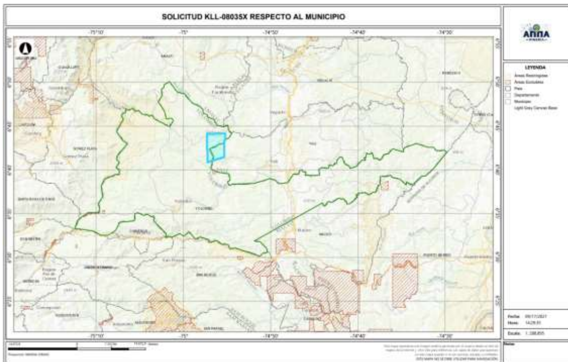
Gráfica N°2 Ubicación geográfica del área de interés

El área está ubicada en las veredas SAN PEDRITO y CASA MORA del municipio de YALI ; SANTO TOMAS , MARACAIBO y AGUABONITA del municipio de YOLOMBO del Departamento de Antioquia , como se muestra en el gráfico N°2: