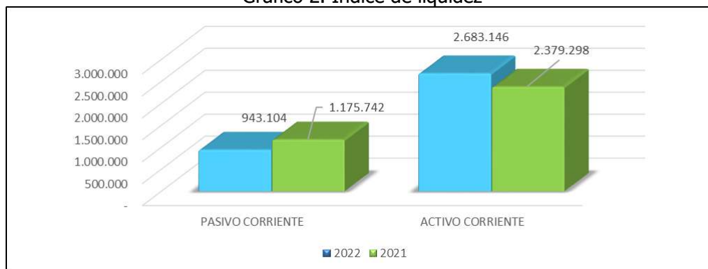
Gráfico 2. Índice de liquidez