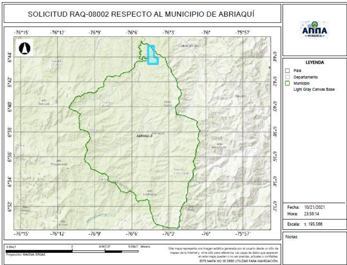
Gráfica N°2 Ubicación geográfica del área de interés

El área está ubicada en las veredas Pontón, La Antigua, Moroto, La Timotea, y La Balsa de los municipios de ABRIAQUÍ, CAÑASGORDAS Y FRONTINO Departamento de Antioquia , como se muestra en el gráfico N°2: