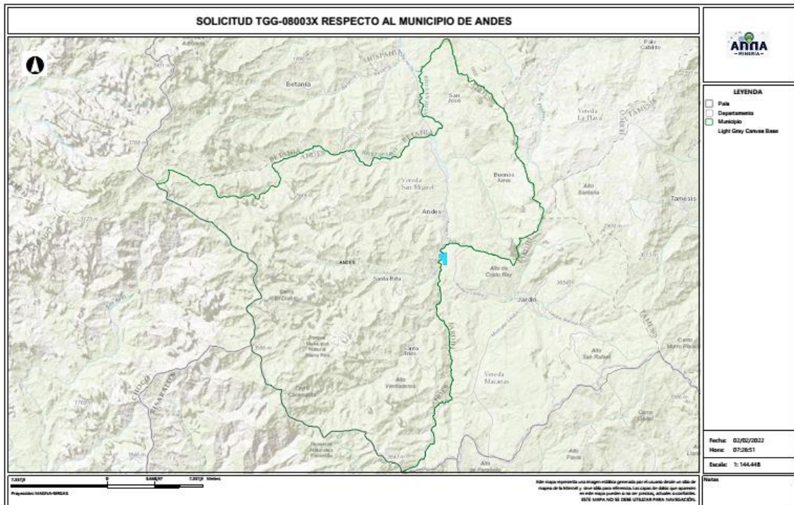
Gráfico N°2 Ubicación geográfica del área de interés

El área está ubicada en las veredas Guaimaral y Cristiania de los municipios de ANDES y JARDÍN Departamento de Antioquia , como se muestra en el gráfico N°2: