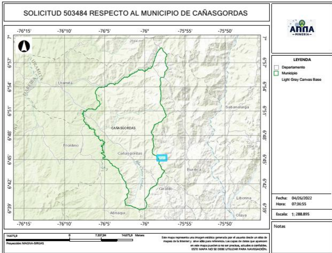
Gráfica N°2 Ubicación geográfica del área de interés

El área está ubicada en las veredas La Cusuti, Sincierco y Santa Teresa de los municipios de CAÑASGORDAS Y BURITICÁ Departamento de Antioquia , como se muestra en el gráfico N°2: