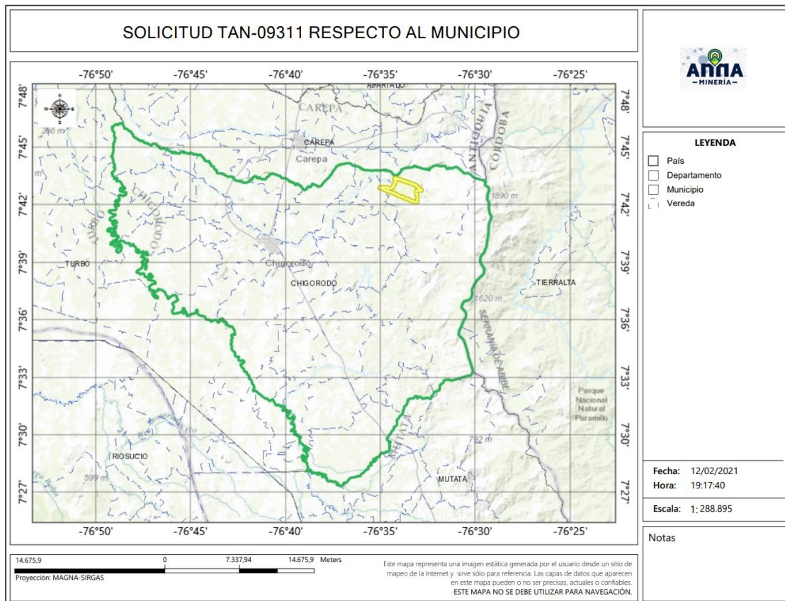
Gráfica N°2 Ubicación geográfica del área de interés

El área está ubicada en las veredas EL COCO, DOJURA Y POLINES del municipio de CHIGORODÓ del Departamento de Antioquia , como se muestra en el gráfico N°2: