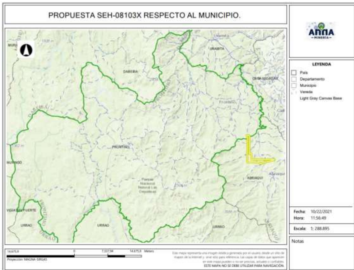
Gráfica N°2 Ubicación geográfica del área de interés

El área está ubicada en las veredas PIEDRAS, LA NANCUY, POTREROS y LAS JUNTAS del municipio de ABRIAQUI ; NOR del municipio de FRONTINO del Departamento de Antioquia , como se muestra en el gráfico N°2: