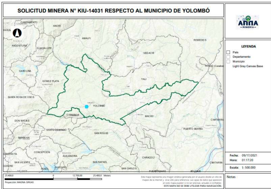
Gráfica N°2 Ubicación geográfica del área de interés

El área está ubicada en las veredas La Marquesa y El Bosque del municipio de Yolombó , Departamento de Antioquia , como se muestra en el gráfico N°2: