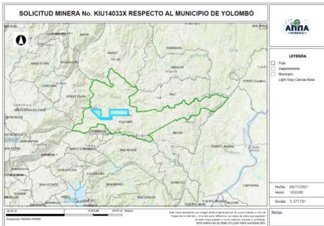
Gráfico N°2 Ubicación geográfica del área de interés

El área está ubicada en las veredas Pantanillo, Sabanitas, Barbascal, La Indiana, El Oso, Perico, Las Margaritas, La Marquesa, Barro Blanco, La Pajita, Pocoro, El Tapón, Las Frías, Alto Del Potrero del municipio de Yolombó, del Departamento de Antioquia, como se muestra en el gráfico N°2: